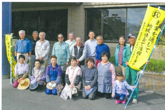
会見地区の皆さん。天萬庁舎周辺の剪定や除草作業を行いました。