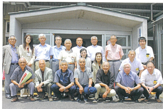
ご指導いただいた雲南市シルバーの皆さんと

センターが誕生しました。新センター誕生後、契約金額、会員数とも順調に伸びており、平成30年度の契約金額は1億7千万円、会員数は414人です。 事業概要についての説明をお聞きした後、南部広域シルバー人材センター役員からは質問が次々にあり、予定時間をオーバーする研修となりました。