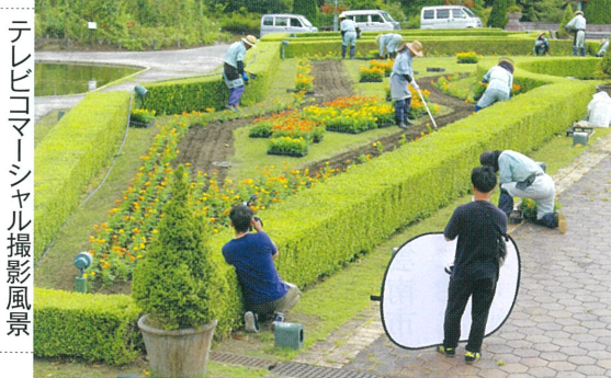
テレビカメラ撮影風景

センター連合会がシルバー人材センターの宣伝のため企画したもので、同施設で就業する本センター会員の皆さんの活躍ぶりが撮影されました。同カメラシヤルは今年3月まで放送予定です。