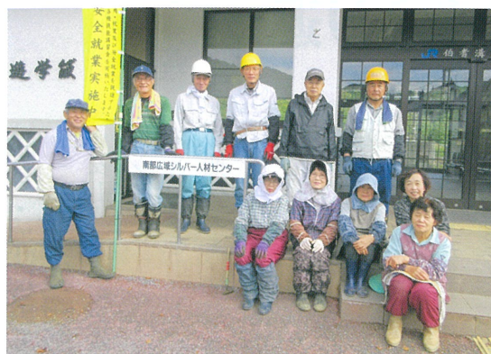
溝口地区の皆さん。溝口駅や溝口中学校で剪定や除草作業を行いました。