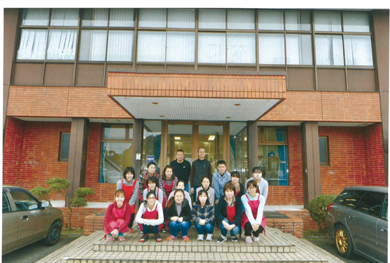
主に百貨店ブランドの婦人服を仕立てるミキソーイングの皆さん