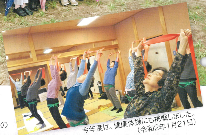
今年度は、健康体操にも挑戦しました。 (令和2年1月21日)

南部広域シルバー人材センターでは「女性のつどい」を毎年開催しています。令和元年度は会員の皆さんの強い要望もあり、昨年度に続き、出雲市にぶどう狩りに出かけました。ぶどう園では高級ぶどう・ピオーネの食べ放題コースを満喫。昼食は同市多伎(たき)のレストランで、海をながめながらのバイキング。食後は同市斐川町にある出西窯(しゅっさいがま)を見学。久しぶりに出会う会員もあり、おしゃべりとグルメ、民芸を堪能した一日を過ごしました。