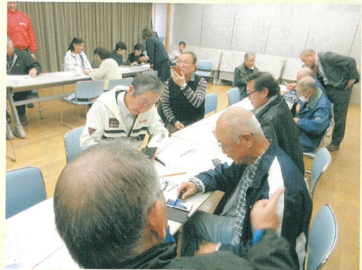
スマホ初心者の方も多数参加

近年急速に普及してきたスマートフォンを、シルバー会員もマスターしようという講習会を、NTTドコモさんのご協力をいただき1月に開催しました。最初は戸惑う方もありましたが、30分もすると地図や駅、観光地など、自分の興味のあるものが検索できるようになり「おもしろい」という感想が多く聞かれました。