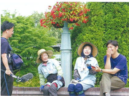
リハースルの様子

昨年夏、とっとり花回廊でシルバー人材センターのテレビカメラシヤルの撮影が行われました。これは鳥取県シルバー人材