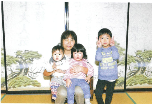
ふすまを替えて部屋が明るくなりました