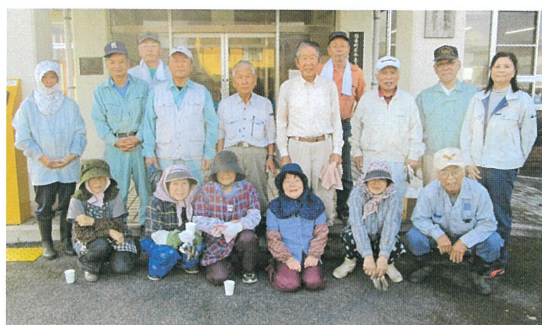
岸本地区の皆さん。岸本老人福祉センターや岸本公民館で、剪定や除草作業などを行いました。

南部広域シルバー人材センターでは、毎年秋に役場や公民館、学校などの公共施設で奉仕作業を行っています。岸本地区は老人福祉センターや公民館、溝口地区は中学校や溝口駅周辺、会見地区は天萬庁舎周辺、西伯地区はプラザ西伯で剪定、草取りなどの作業を行いました。参加した会員の皆さんは、それぞれの作業場所の日頃培った技術を発揮し手際よく作業を進め、半日で各施設をきれいに仕上げました。