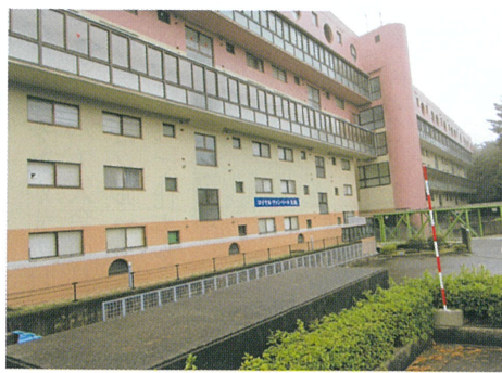
伯耆町丸山にあるロイヤルヴァンペール大山

ロイヤルヴァンペール大山は30年前に伯耆町丸山に建設されたマンションです。シルバーの会員さんにはペットメイキ