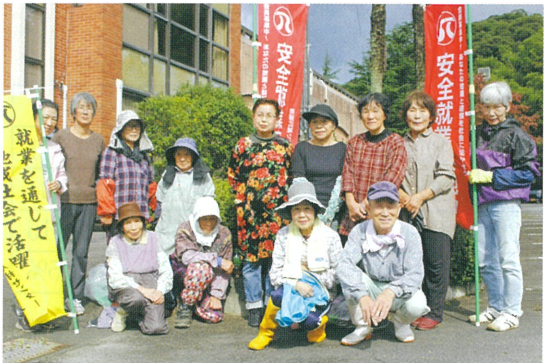
西伯地区の皆さん。プラザ西伯周辺の剪定や除草作業を行いました。