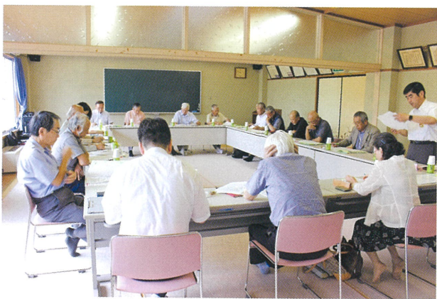
雲南市シルバー人材センターで研修中の本センター役員

着し、シルバー入会者が減少していることが原因です。ちなみに近年のシルバー入会年齢は65歳以上が圧倒的多数となっています。 このような状況に対して本センターでは理事、会員の皆さん、そして職員が力を合せて会員の拡大活動に取り組んでいます。その努力の成果もあって、令和2年1月末現在の会員数は前年度から6人増の360人で、減少に歯止めをかけることができました。