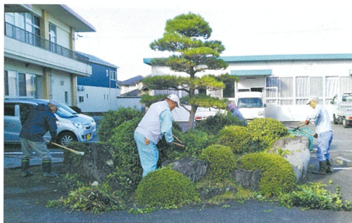
岸本老人福祉センターで奉仕作業を行う会員の皆さん。