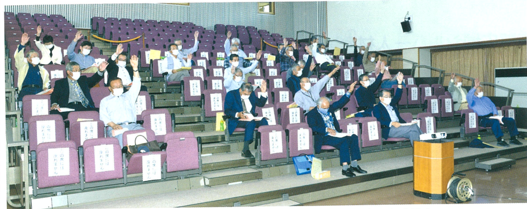
2席ごとに間隔をあげ、少人数で開催された令和2年度の定時総会

5月29日、伯耆町農村環境改善センターで令和2年度南部広域シルバー人材センターの定時総会が開催されました。今年度の定時総会は、新型コロナウイルス感染症予防のため、出席者数を限定するという異例の開催となりました。総会では令和元年度事業報告、決算報告、理事及び監事選任議案が賛成多数で承認されました。