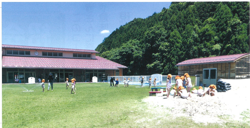
芝生の園庭で子どもたちが元気に遊ぶすみれこども園

シルバーさんには花壇の他に剪定や草取りもしてもらっています。剪定をしてももらったあとの木はすっきりして見えても気持ちがいいです。草取りは夏と春の年2回お願いしています。遊戯室から見えるそよ風の森という中庭がありますが、草取りのあとは見違えるほどきれいになります。きれいな園で子どもたちが元気いっぱい育つ環境を整えていただけて感謝しています。