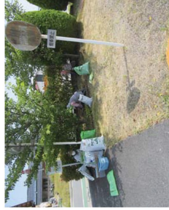
草取り作業（伯耆町内）

カントリーパークの大きな野球場のほか、隣接するテニスコート周辺や公園の草取りも行います。