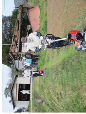
スパイダーモア東演講習会