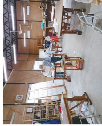
チームワークの良い障子張り班