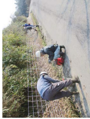
ワイヤメッシュ設置 （南部町内）

剪定は暑さとの戦いに加え、庭木に巣をしているハチにも注意しながらの作業対策も必要。