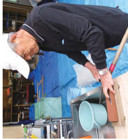
刃物とぎ（会館作業場）