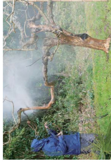
柿の木皮はぎ作業