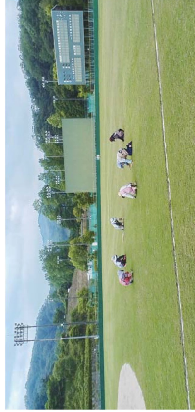
カントリーパーク野球場（南部町内）