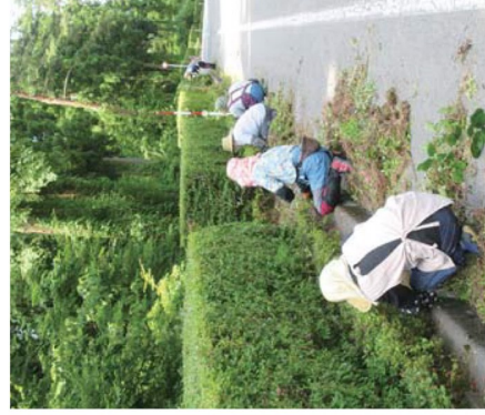
植樹・除草作業（伯耆町内）