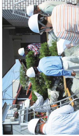
剪定の現場をパトロール中の安全就業対策委員

シルバー人材センターでは、春から秋にかけて野外の就業依頼が増える時期です。4・5ページでは、暑い時期に向けて頑張る会員の皆さんの就業の様子を紹介いたします。