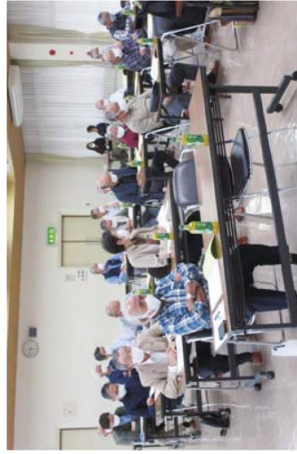
出席者限定で開催された令和4年度の定時総会

今回の総会に出席したのは理事及び監事並びにその候補者、地域班長の29名。窓を開放して通気を確保する、マス