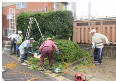
剪定作業と清掃作業の様子