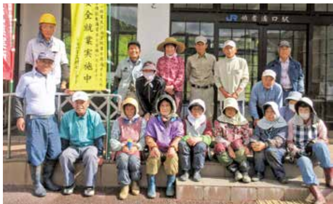
溝口駅や溝口中学校での奉仕作業に参加した溝口地区の皆さん