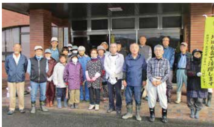
プラザ西伯周辺の剪定や除草作業での奉仕作業に参加した西伯地区の皆さん