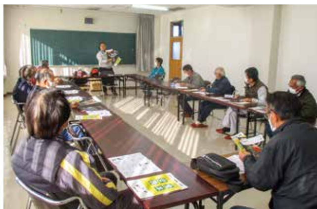
刈払機の安全な使い方を学ぶ参加者の皆さん