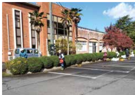
プラザ西伯周辺の剪定・清掃作業の様子