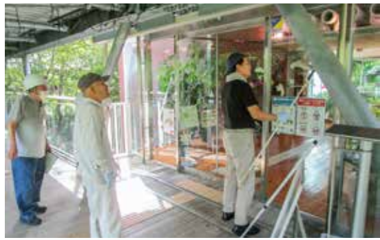
窓ふきの作業現場をパトロール中の理事の皆さん