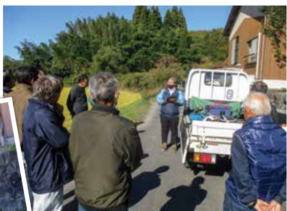
実技の前の説明を受ける参加者の皆さん