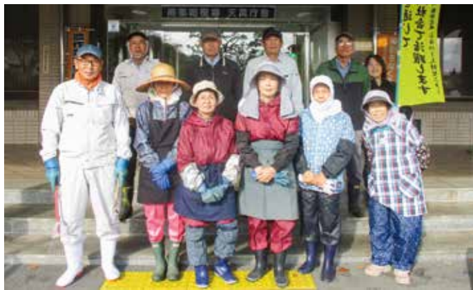
天萬庁舎周辺の剪定や除草などの奉仕作業に参加した会見地区の皆さん

地域の皆様からご理解とご支援をいただき、シルバーが理念とする地域社会への貢献とシルバーの存在意義を高めていきます。今回も多数の会員の皆さんにご参加いただき、とても綺麗になりました。日ごろから作業をされているだけあって、手際よくきれいにいただきました。お忙しい中多くの会員の皆さんのご参加有難うございました。