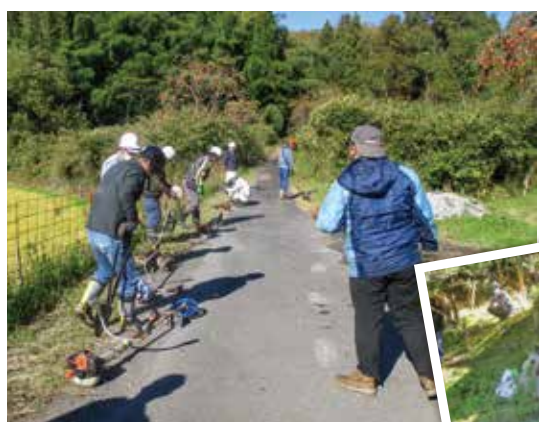
使用する前の事前点検