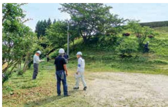
草刈りの作業をチェックする安全就業対策委員の皆さん

刈払機(草刈機)による事故は、取り扱いの不慣れ、姿勢の悪さによる転倒、刈刃の跳ね返りなどによる刈刃に接触する等、原因はさまざまです。事故の発生状況を見ると、使用者が安全作業に必要な基本知識や正しい使用方法を理解していないことが大きな要因となっています。当センターでは刈払機を安全に取り扱うための知識や操作方法等について講習会を実施しました(令和5年11月25日実施)。