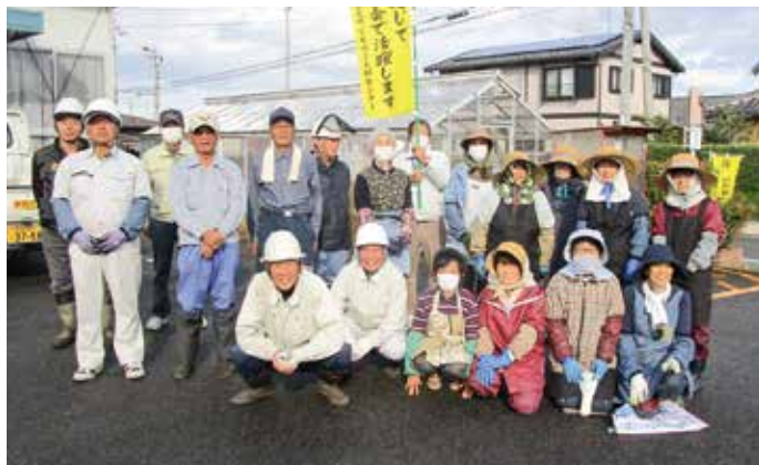
岸本老人福祉センターや岸本公民館での奉仕作業に参加した岸本地区の皆さん