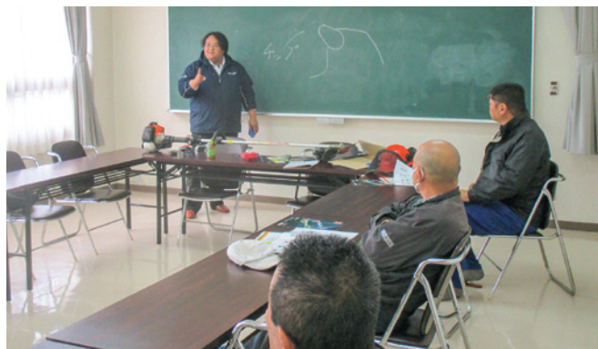
チップソーの研磨の方法を学ぶ参加者の皆さん

草刈機の安全使用の基礎知識を学ぼう!! 当センターでは11月18日に、刈払機を安全に取り扱うための知識や操作方法等について講習会を実施しました。当日はあいにくの雨で実技講習はできませんでしたが、講義では安全使用の基礎、作業現場の事前の確認、作業前の草刈機の各部の点検、長期格納時の方法等、安全な作業方法やメンテナンスの仕方などの重要性を学びました。今回受けた講習を生かし、より安全かつ効率的に草刈り作業に取り組みでいただきたいと思います。