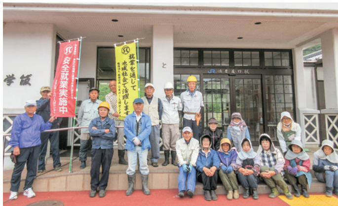
溝口駅や溝口中学校での作業に参加した溝口地区会員の皆さん