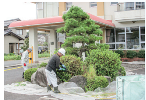
岸本地区作業の様子