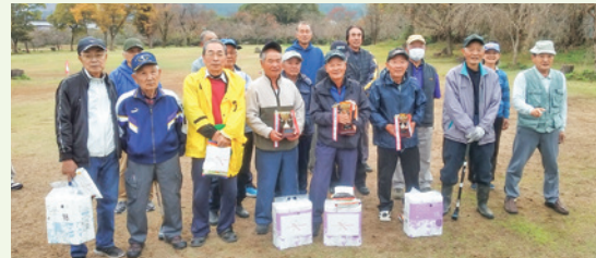
参加した会員の皆さん

11月16日(土)に、第19回南部広域シルバー人材センターグランドゴルフ大会を、溝口のささふく水辺公園で開催しました。天候にも恵まれ、ほかほか陽気のもと参加者の皆さんは日頃の練習の成果を発揮し熱戦を繰り広げました。各ホールでは拍手が沸き起こり、笑顔があふれていました。今後も様々な企画を計画していきます。次回の大会もご期待ください。