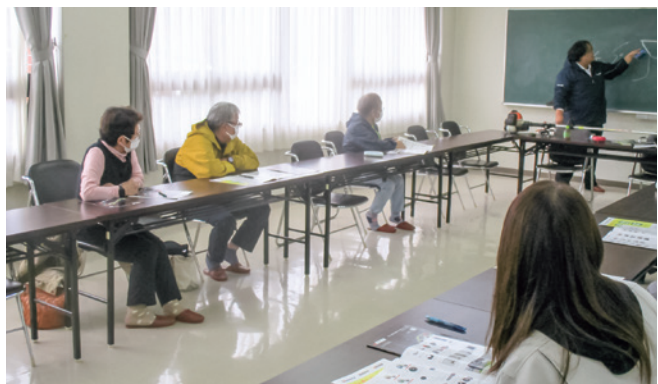
真剣に講義に耳を傾ける参加者の皆さん

草刈機の安全使用の基礎知識を学ぼう!! 当センターでは11月18日に、刈払機を安全に取り扱うための知識や操作方法等について講習会を実施しました。当日はあいにくの雨で実技講習はできませんでしたが、講義では安全使用の基礎、作業現場の事前の確認、作業前の草刈機の各部の点検、長期格納時の方法等、安全な作業方法やメンテナンスの仕方などの重要性を学びました。今回受けた講習を生かし、より安全かつ効率的に草刈り作業に取り組みでいただきたいと思います。