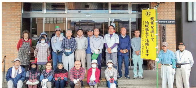
法勝寺庁舎の除草などの作業に参加した西伯地区会員の皆さん

くことや、参加する会員相互の交流も深めるなど、日頃の感謝の気持ちを込めて実施します。 地域の皆様からご理解とご支援をいただき、シルバーが理念とする地域社会への貢献とシルバーの存在意義を高めていきます。今回も多数の会員の皆さんのおかげで、とても綺麗になりました。お忙しい中参加いただき、有難うございました。