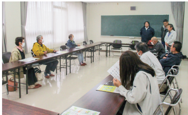
安全使用の基礎、各部の点検を学ぶ参加者の皆さん