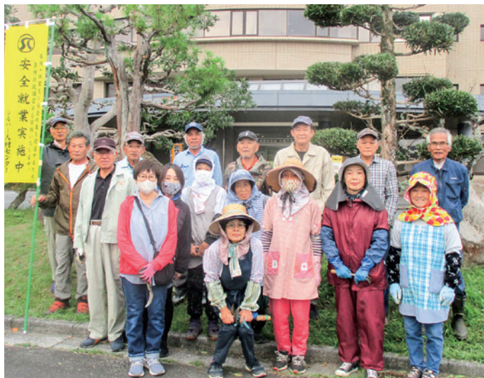
天萬庁舎周辺の除草などの作業に参加した会見地区会員の皆さん