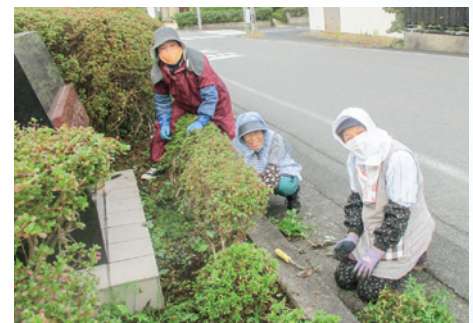
会見地区作業の様子