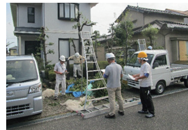
剪定作業をチェックする安全就業対策委員の皆さん