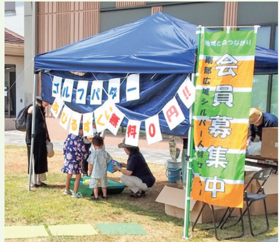
子どもに大人気「あひるすくい」

8月4日(日)に、「キナルなんぶ」でイベントが開催されました。南部広域シルバー人材センターでは、より多くの方にシルバー人材センターの活動を知っていただき、会員拡大のためにイベントへ参加しました。当日はバターゴルフやあひるすくいなど子どもさんにも大変好評でした。今後も会員が安心して働ける環境づくりを目指し、様々な取り組みを進め会員拡大に向けて活動します。