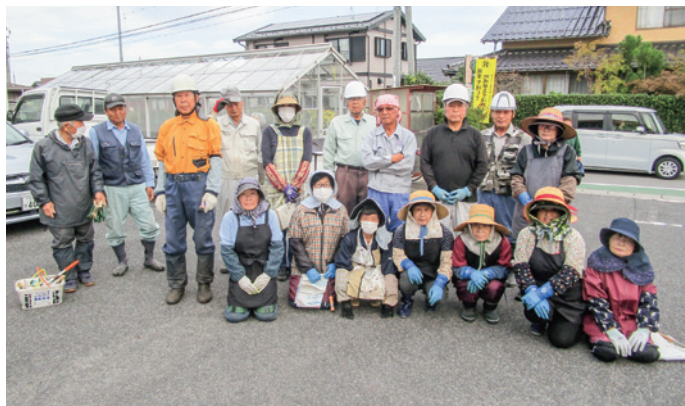
岸本老人福祉センターや岸本公民館での作業に参加した岸本地区会員の皆さん