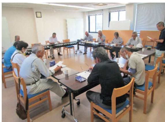
理事によるパトロール終了後の検討会議